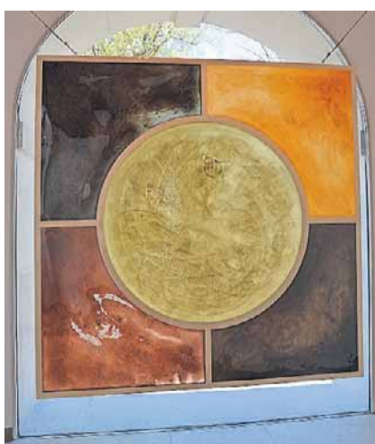
Zeitlose Erinnerungssikone: Zofinger Steinpigmente in Kunstharz.

Vernissage heute Samstag, 17 Uhr; Öffnungszeiten jeweils Samstag 11 bis 17 Uhr und Sonntag 10 bis 18 Uhr. Programm der Ausstellung: www.kunsthauuszofingen.ch