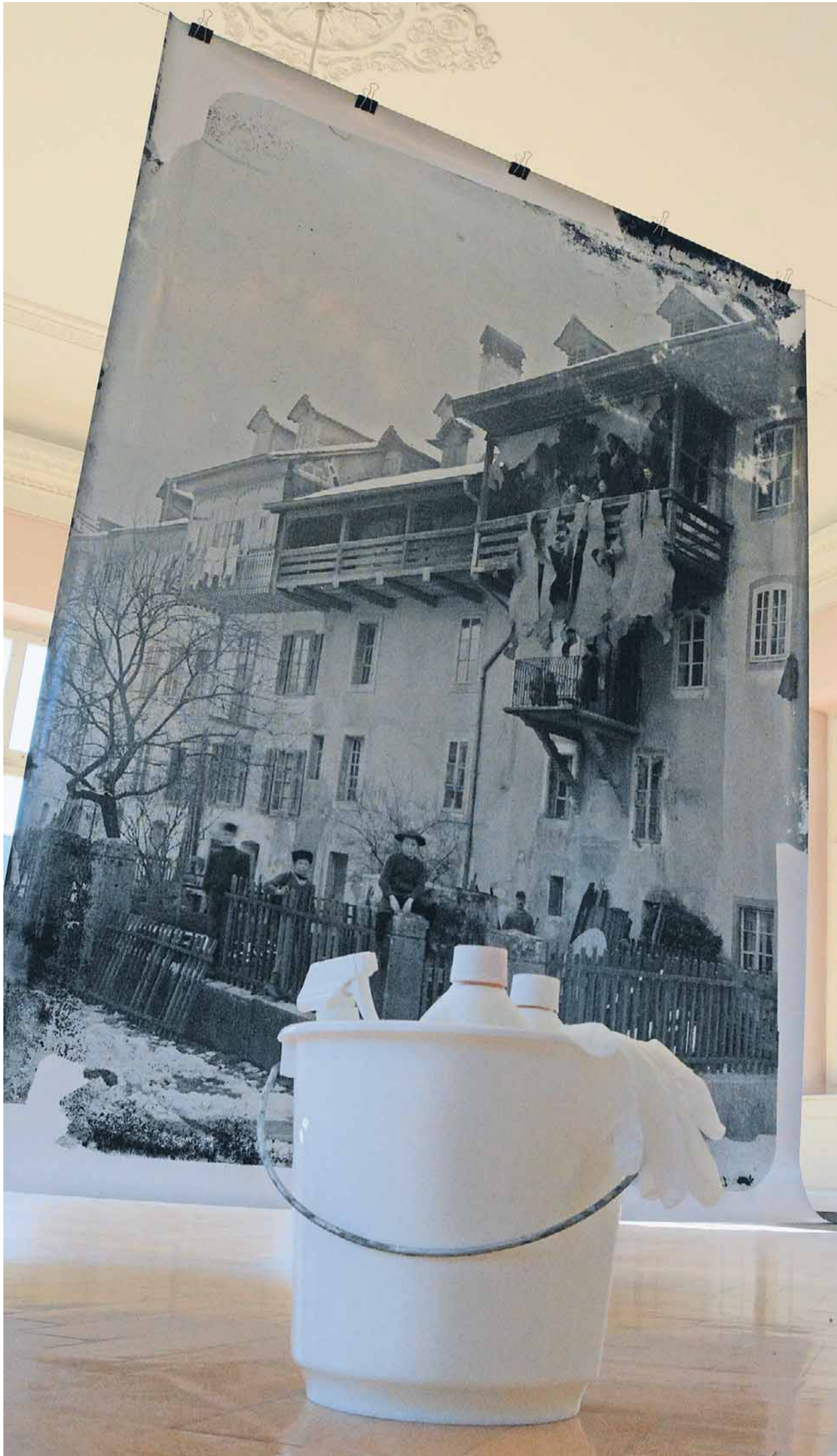
Anna-Sabina Zürrier wird diesen Lambda-Print mit Chemikalien besprühen. Das Grau der ehemals an der General-Guisan-Strasse stationierten Gerberei Friderich wird sich in Schlieren von Cyan, Magenta, Yellow und Black auflösen. MIF